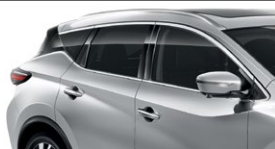
Серебристый — K23