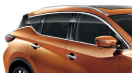
Оранжевый — EAW