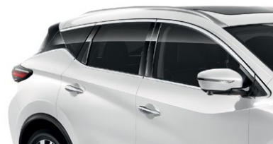
Белый перламутр — QAB