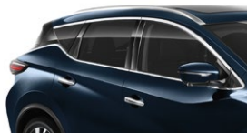
Темно-синий — RBG