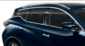
Темно-синий — RBG