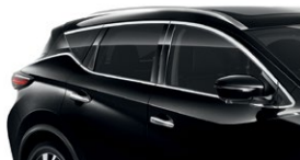
Черный — G41