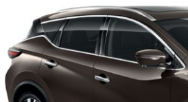
Серо-коричневый — CAM