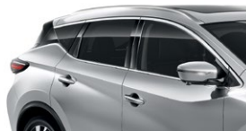
Серебристый — K23