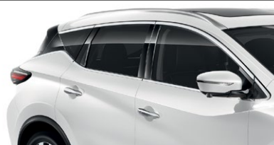
Белый перламутр — QAB