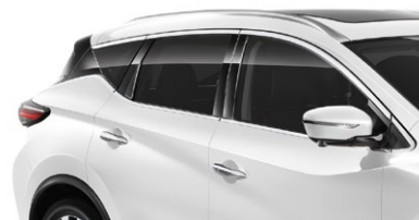
Белый перламутр — QAB