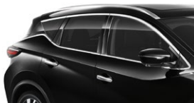
Черный — G41