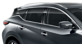
Темно-серый — KAD