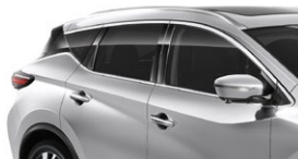
Серебристый — K23